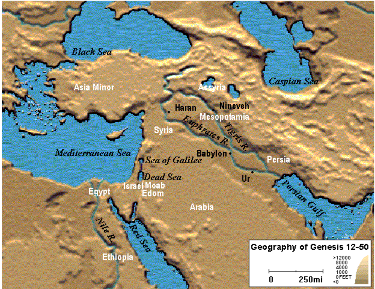
ஆதியாகமம் 12-50. புவியியல் நிலமை

12:4-9 ஆபிரகாம் 75வயதில் வேறுபிரிக்கப்பட்டார்.